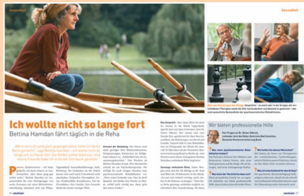
Authentische Beispiele zeigen, wie eine Rehabilitation Arbeitnehmer wieder fit für den Job macht.