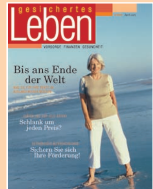
Mehr als 50 Jahre Erfahrung: Das Vorgängermagazin „gesichertes Leben“ erschien 1954 bis 2006