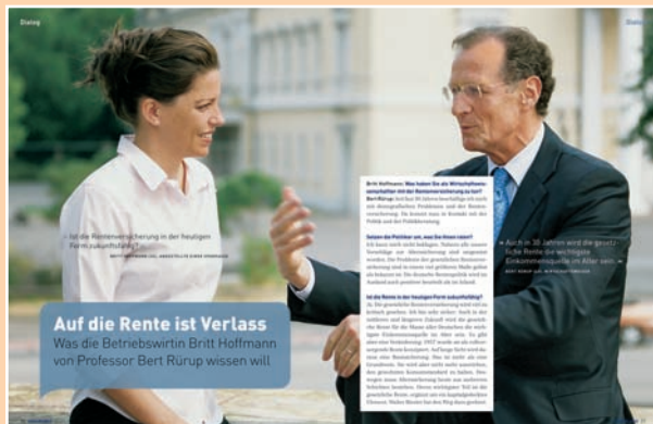
Auf Augenhöhe mit den Experten: zukunft jetzt bringt hochkarätige Fachleute und Versicherte zusammen.