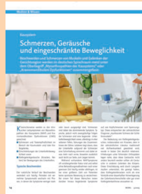
Medizin & Wissen ... informiert kompetent aus erster Hand über Neues und Bewährtes