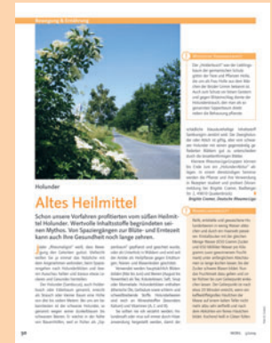
Bewegung & Ernährung ... motiviert zum gesunden Leben