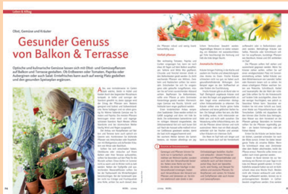
Leben & Alltag ... bietet Hilfe von Mensch zu Mensch

Fachliche Kompetenz der Redaktion und praxisorientierte Berichterstattung in den festen Rubriken Medizin & Wissen, Leben & Alltag, Bewegung & Ernährung, Rheuma-Liga Aktiv, Politik & Soziales und Tipps & Trends optimieren permanent die Bindung der Leser an ihr mobil.