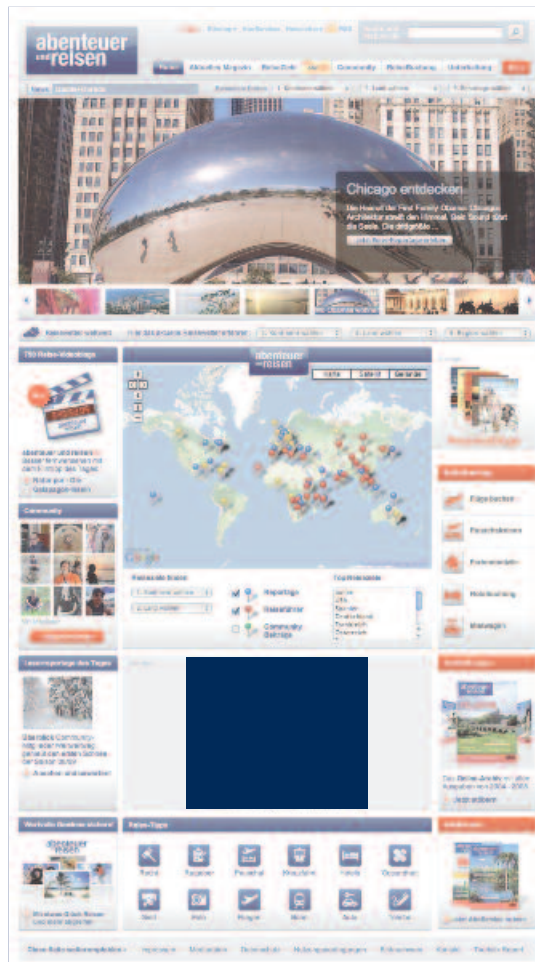
Content Ad / Small Rectangle (180 x 150 Pixel)