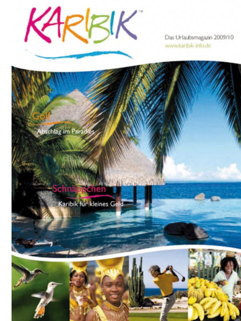
KARIBIK Magazin Partner: Caribbean Tourism Organisation