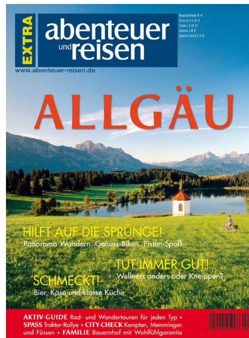
abenteuer und reisen EXTRA „Allgäu“ Partner: Allgäu Marketing GmbH