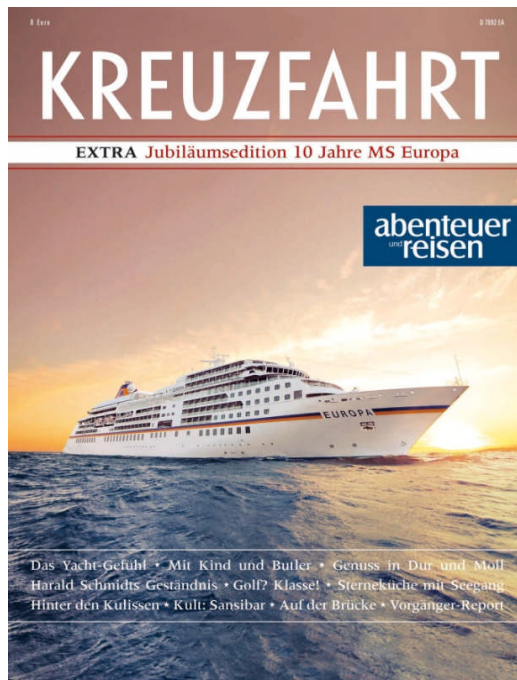
abenteuer und reisen EXTRA „MS Europa“ Partner: Hapag-Lloyd Kreuzfahrten