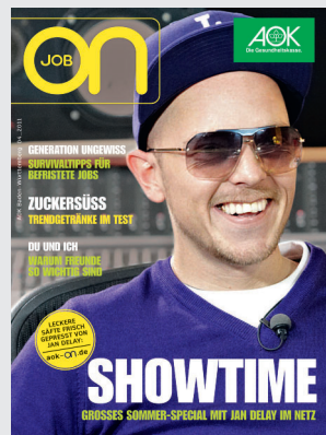
on job 4/2011