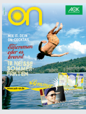
on xxl-Poster 3/2011