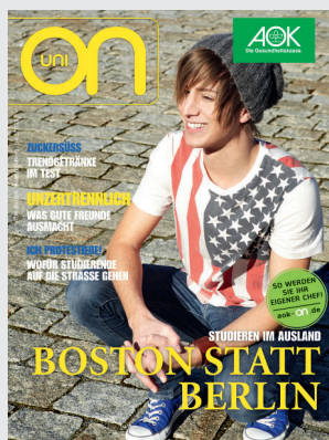
on uni 4/2011