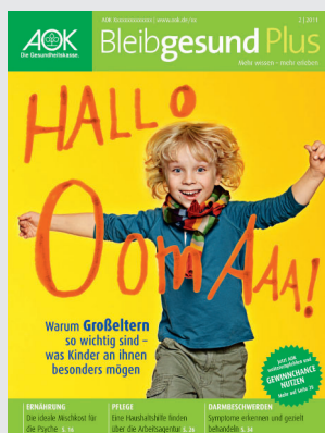
Bleibgesund Plus 2/2011