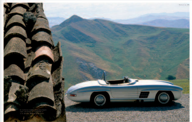
Exklusive Optik: Die Storys werden durch Top-Fotografen in Szene gesetzt.