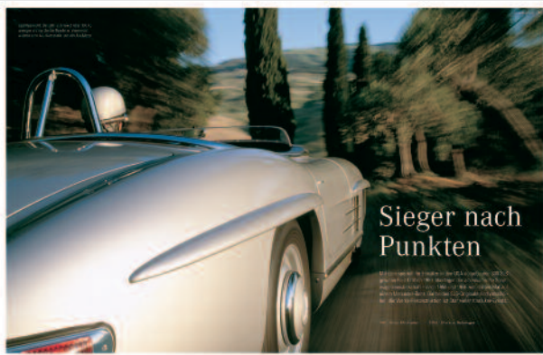
Faszination: „Stars“ der Markengeschichte wecken Emotionen.