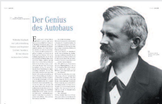
Maybach-Porträt: Die Kompetenz des Unternehmens wird durch Innovatoren-Porträts kommuniziert.