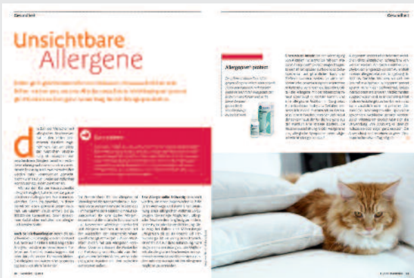
Gesundheit: Erkrankungen und die Rolle von Phytopharmaka bei deren Behandlung