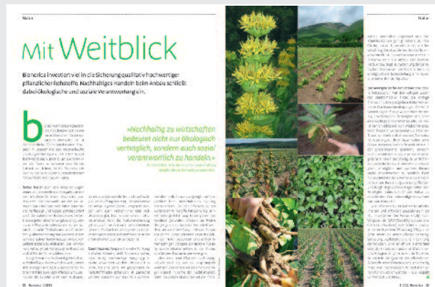
Hintergrund: Verfahren zu Saatgutauswahl, Standortfindung, Anbau, Ernte und Verarbeitung von Heilpflanzen