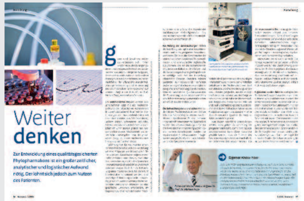
Einblicke: Innovative technologische Verfahren zur Erschließung und Weiterentwicklung pflanzlicher Wirkstoffe