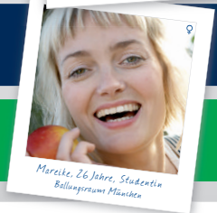
Merveke, 26 Jahre, Studentin Bellingersheim München